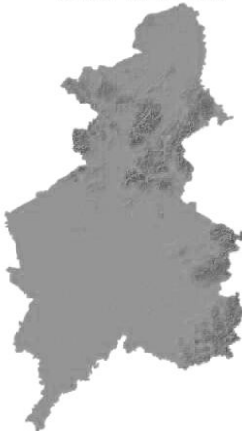
图2 沈阳市坡度分级分布