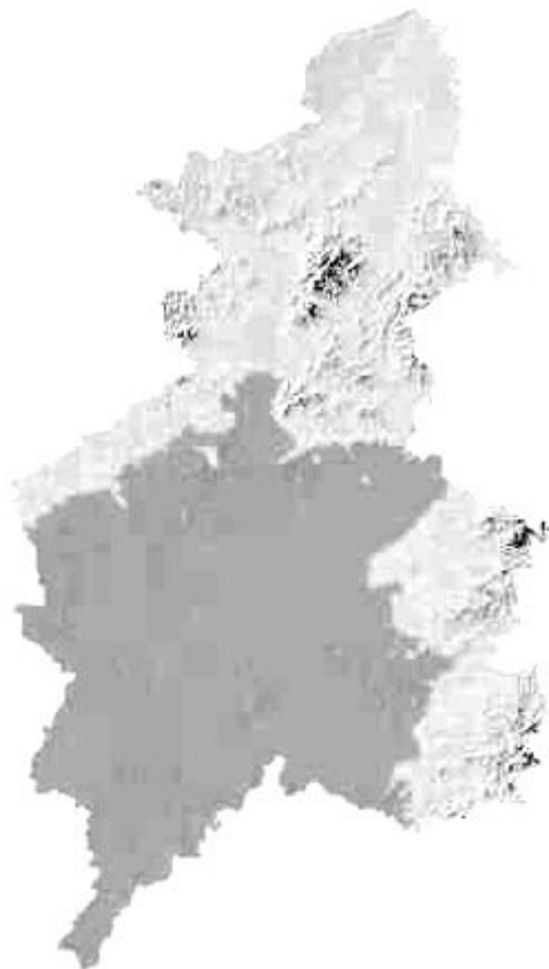
图1 沈阳市高程分级分布